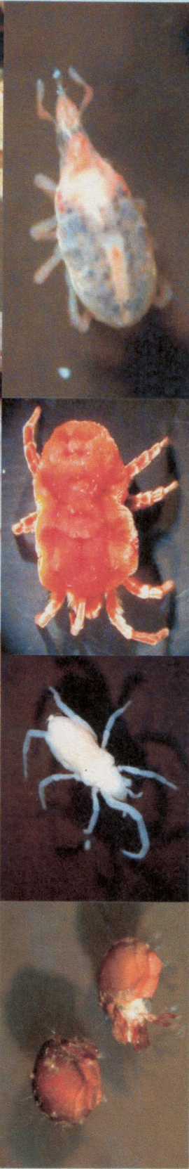
----- Collemboles, acariens, vers, etc. épigés (surface) -----